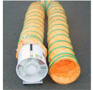
Flexible Duct And Filter Bag