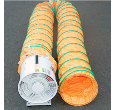
THYPOON U12, WINMAMA